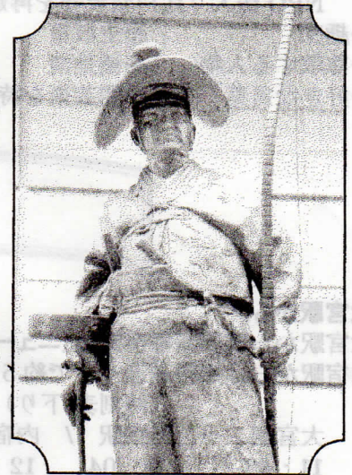
太田道灌公像(東京フォーラム)

埼玉県(武蔵国)は室町時代後期、戦国の世の先陣を切って、戦いの舞台となったと言われています。その時代に関東で活躍した名将太田道灌公の生き様を、武蔵国(埼玉)との関連性を含めて、道灌公の第18代子孫である太田資曉氏にお話していただきます。